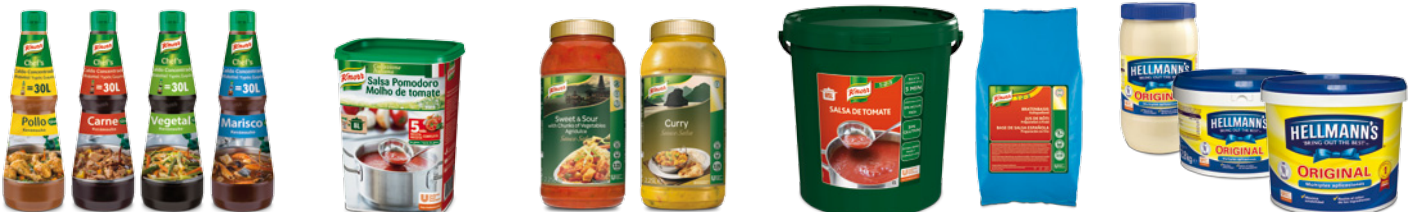
Caldos Líquidos Concentrados de Pollo, Sabor Carne, Vegetal y Marisco