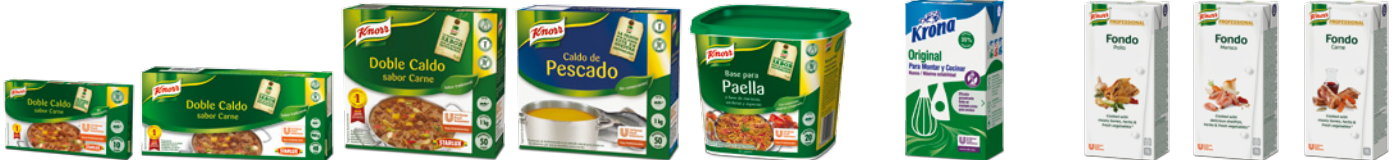
Caldo Doble Carne Pastilla Knorr 72 pastillas