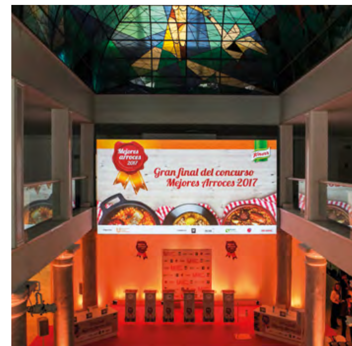
Gala Final en el Palacio Neptuno (Madrid)