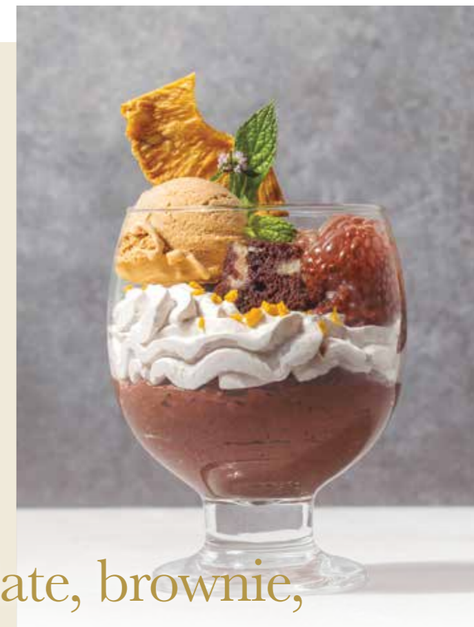
Copa de chocolate, brownie, chantilly de plátano y coco helado de caramelo salado