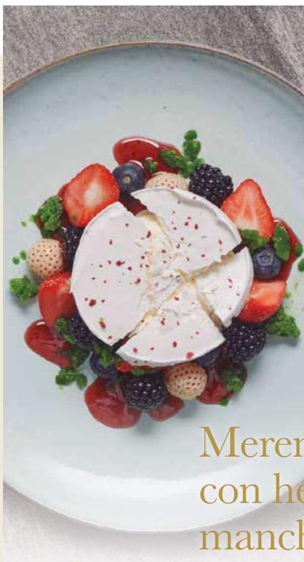
Merengue deconstruido con helado de queso manchego y frutos rojos

Disponer una bola de Helado de queso manchego Krea, servir unos frutos rojos alrededor del helado y salsear con el Sirope de frutos rojos Carte d'Or. Colocar el disco de merengue sobre el helado y romper con la base de una cuchara.