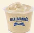
Diperas para delivery o take away