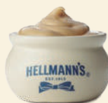
Diperas de cerámica