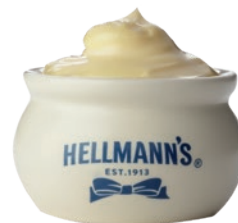
Dipera de cerámica