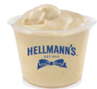
Dipera para delivery o take away