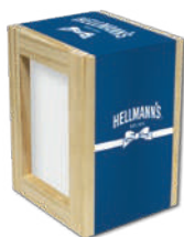
..... Servilletero .....