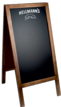
..... Pizarra .....