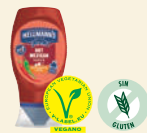
Salsa Hot Mexican