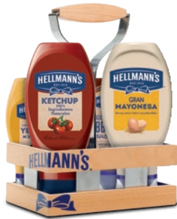
..... Porta bocabajos de madera .....

Consulta con tu gestor o en el 902 101 543 la disponibilidad de cada material