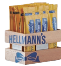
..... Porta monodosis de madera .....