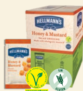
Salsa Miel y Mostaza