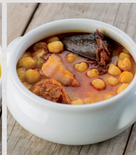
Guiso de legumbres