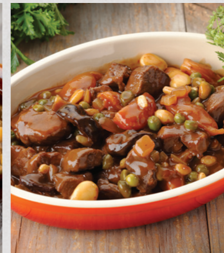
Estofado de ternera