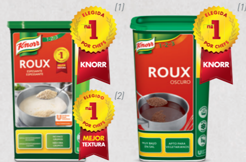
Roux (Harina de Trigo y Grasa)