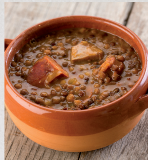
Lentejas con chorizo

Sopas, cremas, estofados y guisos... las recetas más típicas de la temporada de frío indispensables en tu menú o carta.