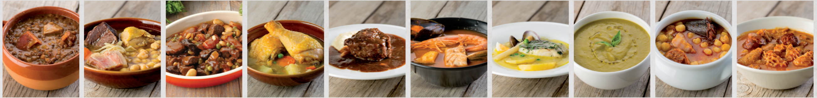
Lentejas con chorizo

Té ayudamos en en tus procesos de cocinado en función de lo que busques, en cualquier momento y según tus necesidades.