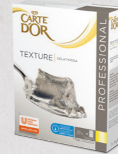
Textura Gelatinosa (Gelatina, Colageno de Vacuno)