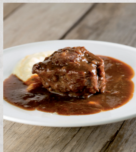
Rabo de toro