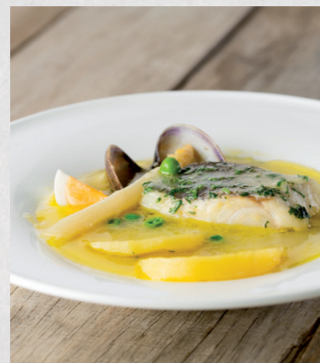
Guiso de pescado