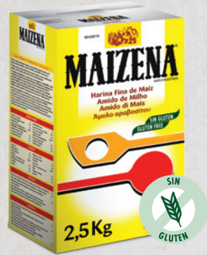
Maizena® (Fécula 100% de Maíz)