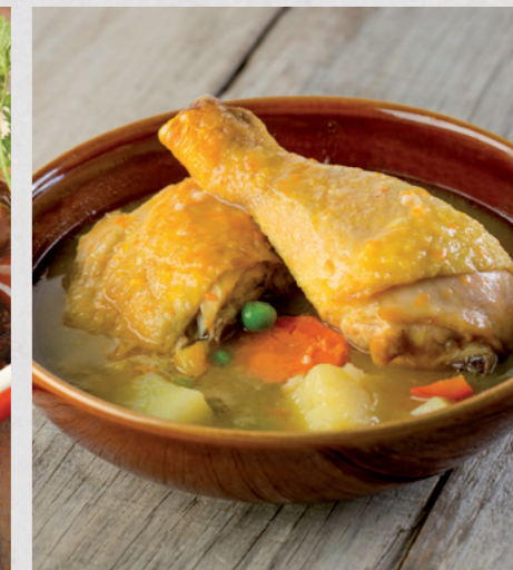
Guiso de pollo