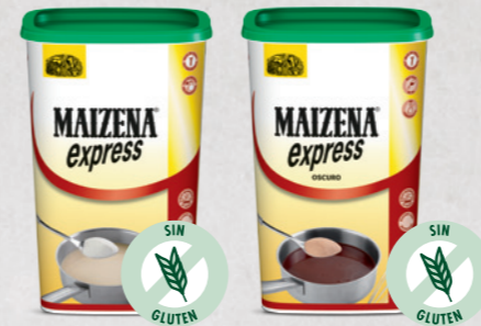
Maizena® Express (Fécula de Patata + Harina de Arroz)