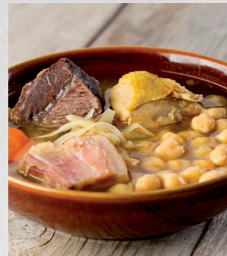
Sopa de cocido