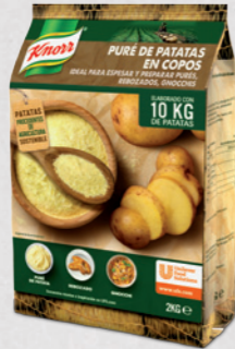
Puré de Patata (99% de Patata)