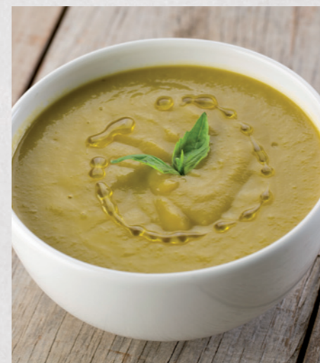
Crema de verduras